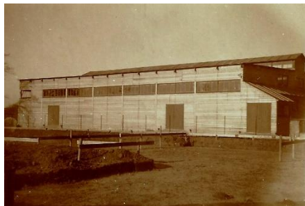
Noodkerk 1933 - 1934

6 Aug. werd de oude kerk verlaten en werd de noodkerk in gebruik genomen op de speelplaats v.d. Meisjesschool.